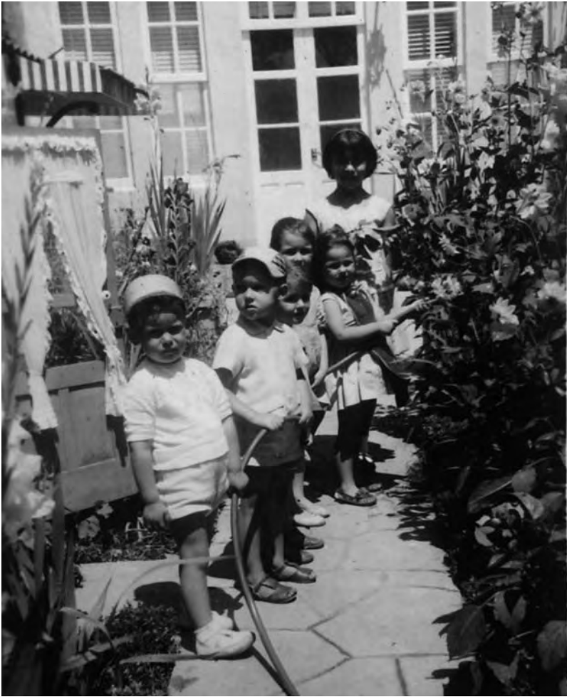
A porta de atrás da casa dos Caramés, anos máis tarde dos feitos relatados.