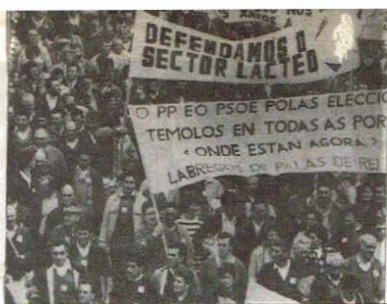
Manifestación do día de abril en Santiago, convocada polo Sindicato Labrego Galego (CCLL), na que participaron máis de 30.000 persoas, cunha grande presenza de produtores da estrada.

< A NEGATIVA DO PP E PSOE A BUSCAR UNHA SOLUCION MOSTRA A SUA SUBORDINACION A POLITICA COMUNITARIA E INCAPACIDADE PARA DAR ALTERNATIVAS AOS PROBLEMAS QUE SOFRE GALIZA. >