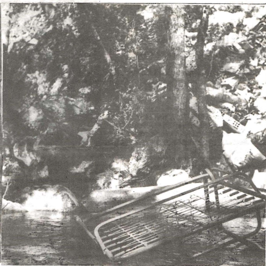
Un de tantos vertedeiros incontrolados. Destrución da paisaxe, contaminación, focos de lume . . .